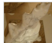
L'écume des jours