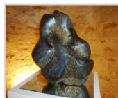
Les vagues du plaisir