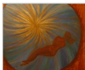
L'oeil du désir